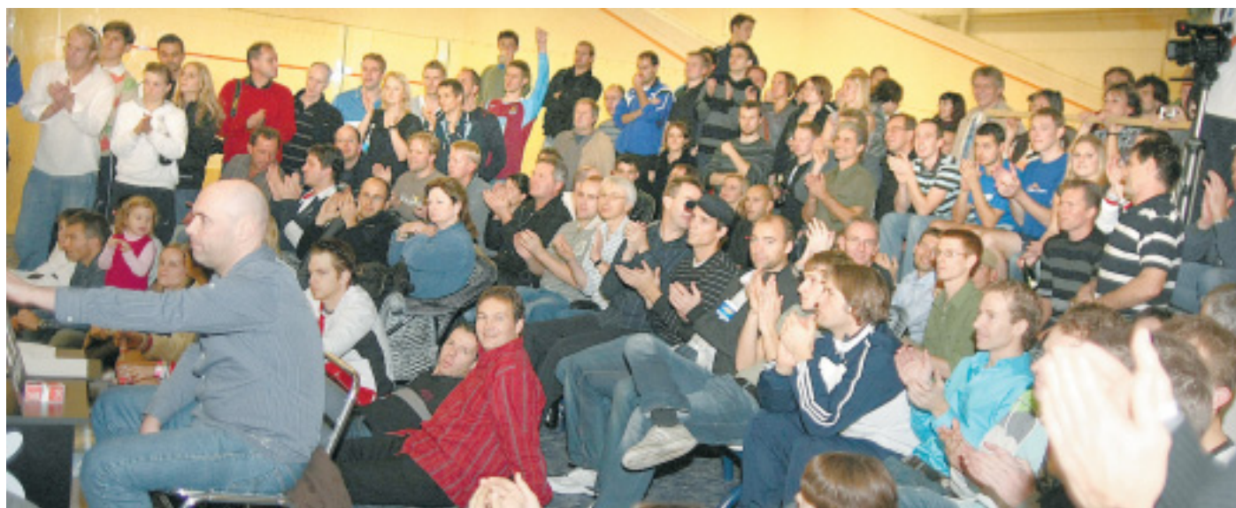
Applaus, Applaus: Viele Zuschauer im Löhner Kaiser-Center verfolgten die Spiele am Samstag, dem Final-Tag, hier vor dem Squash-Court.