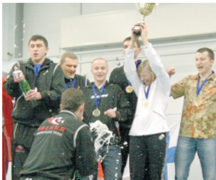
Die Party kann beginnen: Das polnische Team ist Weltmeister.